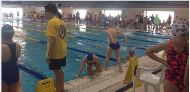
La piscina dels Jesuïtes s'omplirà de diversió i motivació

serà l'hora del descans i el moment de recuperar forces. De 15.30 a 17.00 h., saltaran dins l'aigua els benjamins.