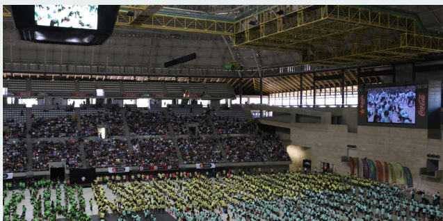
Dansa Ara ha omplert el Sant Jordi de colors, alegria i moviment!

7 anys de la ciutat. Aquests escolars han mostrat, agrupats pels colors que llueixen les seves samarretes, el resultat final del treball