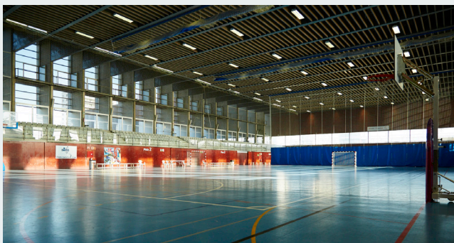
Tot controlat de cara a la temporada que ve!

són alguns d'aquests canvis. Ara, la prioritat és el sostre del pavelló i SEROM, empresa catalana que portarà a terme les obres fins al 15 de setembre, ho deixarà tot a punt per a la temporada 2018-2019!